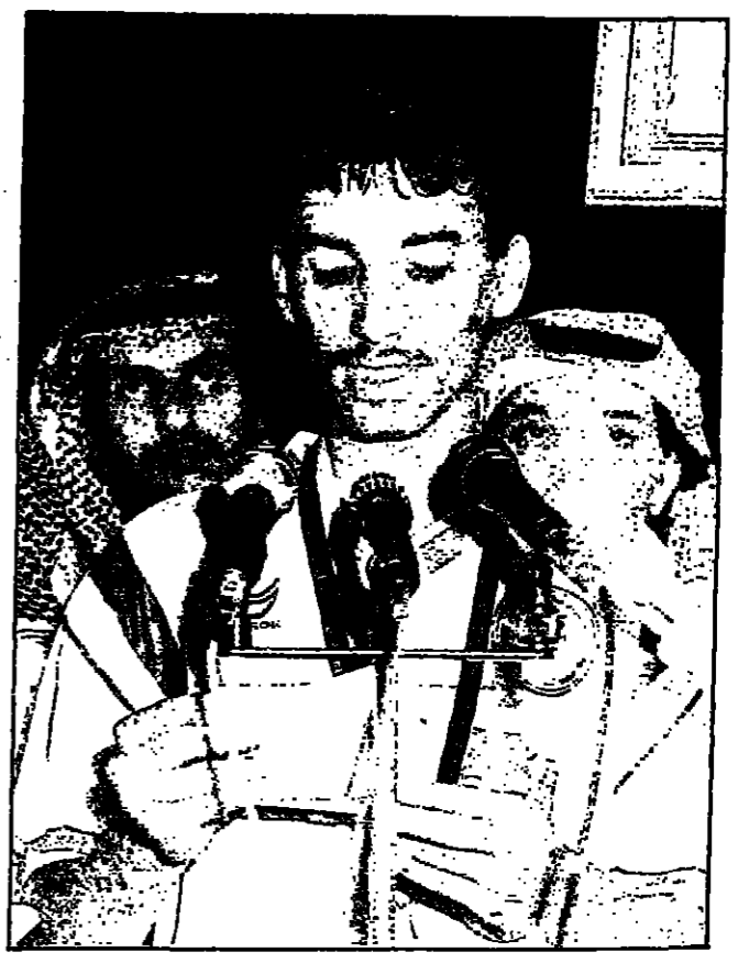
لسان الحمالي يرفق فرحة التفشين وعرفتهم